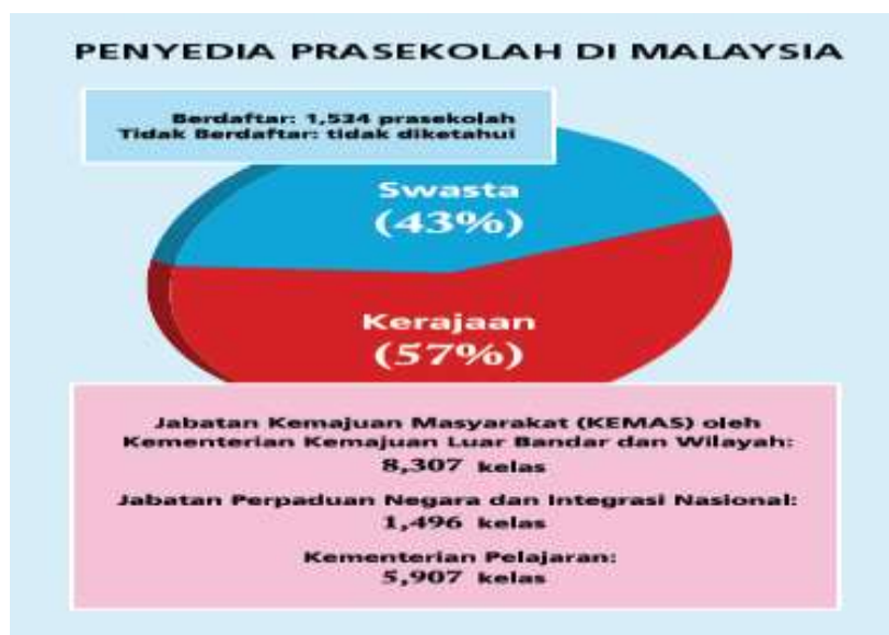
Rajah 2 Penyedia Prasekolah di Malaysia