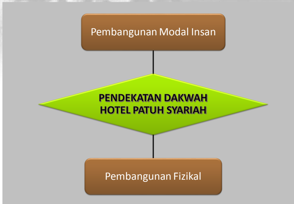
Rajah 1 Piawaian Pendekatan Dakwah Hotel Patuh Syariah

kemudahan patuh syariah, hiburan yang tidak bertentangan dengan syariat Islam dan mempunyai rancangan saluran informasi Islam.