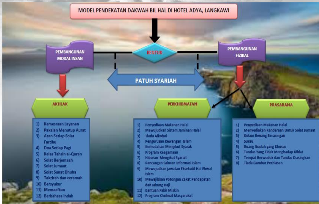
Rajah 5 Model Pendekatan Dakwah Bil Hal di Hotel Adya, Langkawi