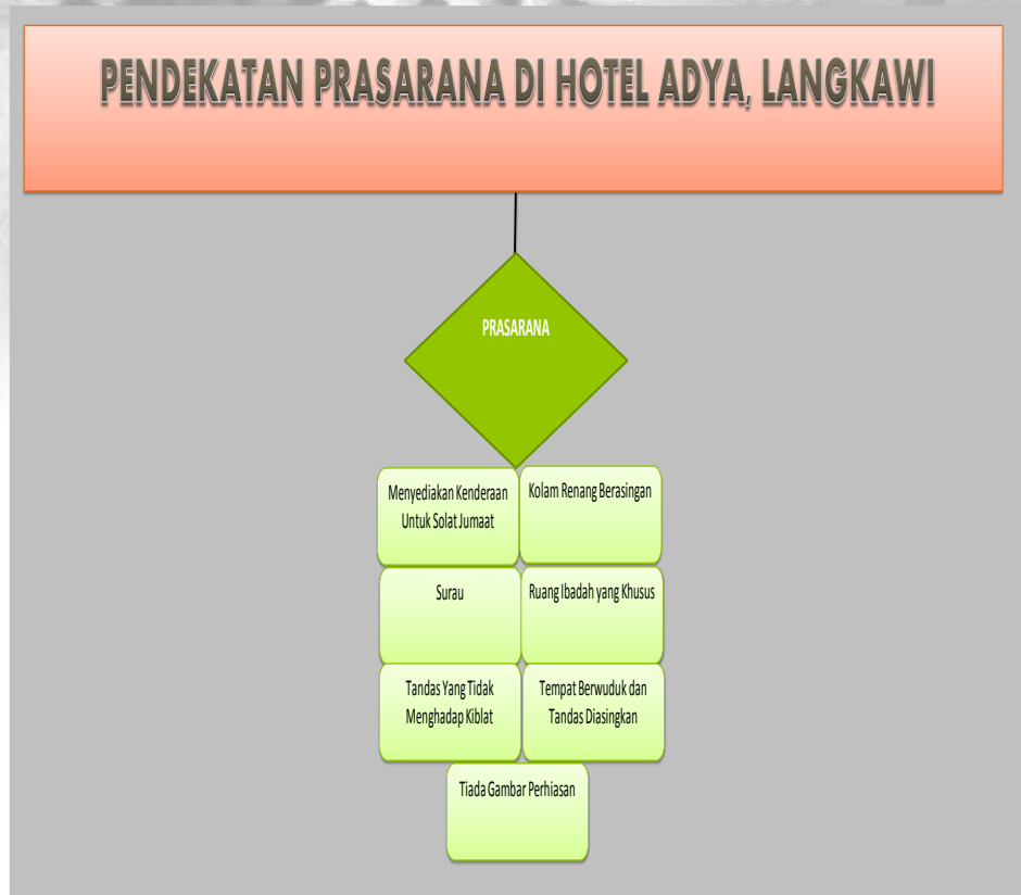
Rajah 4 Pendekatan Prasarana di Hotel Adya Langkawi