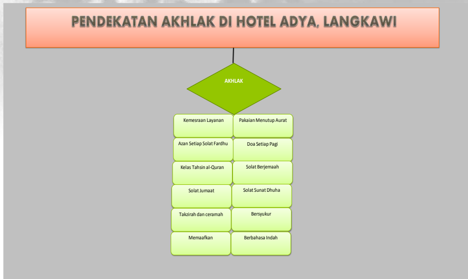
Rajah 2 Pelaksanaan Pendekatan Akhlak di Hotel Adya Langkawi

Eksekutif Hal Ehwal Islam, potongan zakat pendapatan dan tabung haji di kalangan staf, bantuan fakir miskin dan program khidmat masyarakat.