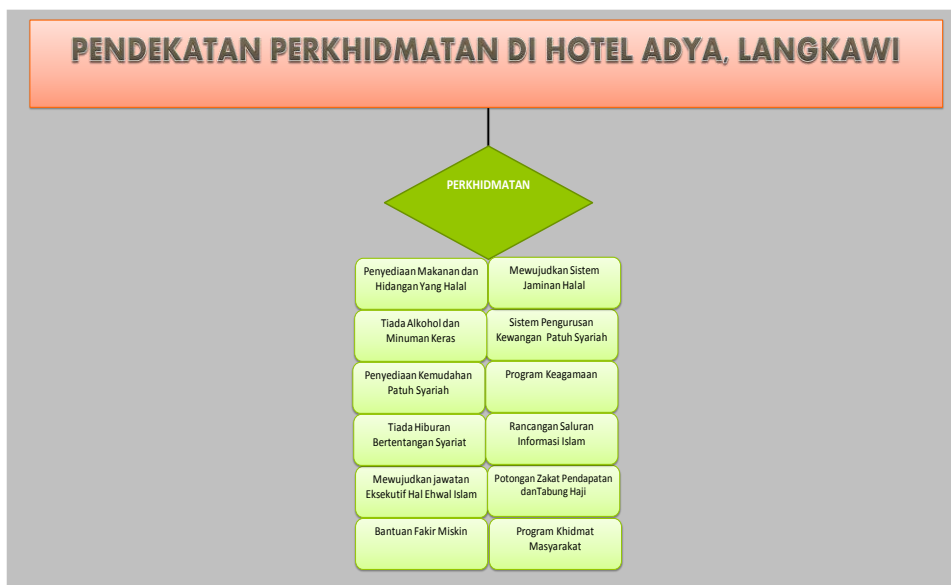
Rajah 3 Pendekatan Perkhidmatan di Hotel Adya Langkawi

Terakhir dari aspek pendekatan prasarana yang disediakan oleh hotel berkenaan, analisis tree nodes di Rajah 4 menunjukkan prasarana-prasarana yang disediakan oleh hotel tersebut adalah menyediakan kenderaan untuk solat jumaat, kolam renang berasingan, surau, ruang ibadah yang khusus, tandas yang tidak menghadap kiblat, tempat berwuduk dan tandas diasingkan serta tiada gambar perhiasan yang ditegah oleh syariat.